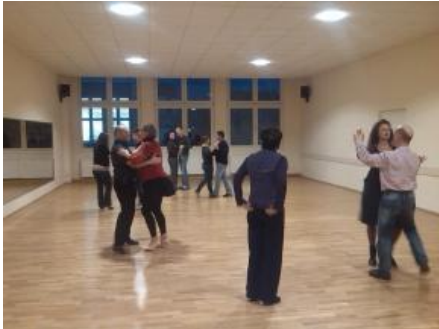
Unterricht in kleinen Gruppen

Tanzen ab 18 eur / Monat im Tanzklub "Orchidee" Chemnitz e.V.