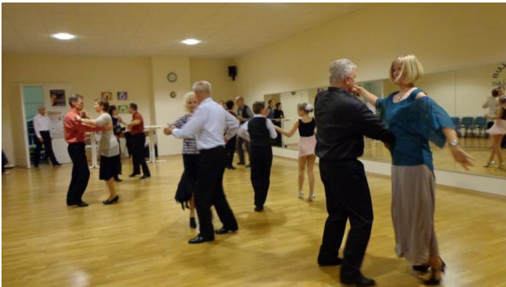
DTSA Abnahme 2014 im Vereinsheim des Tanzklub "Orchidee" Chemnitz e.V.