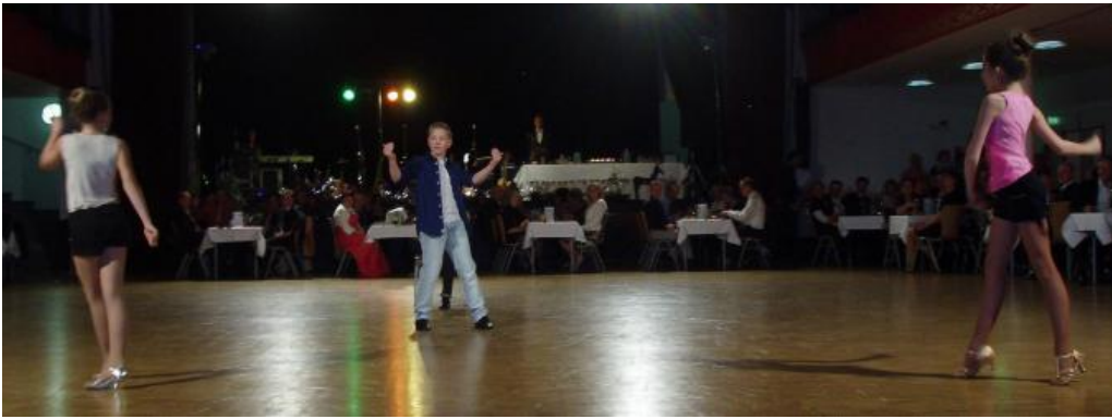
Lateinshow der Junioren des TKO