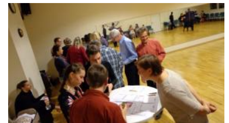
Die Auswahl der zu prüfenden Tänze