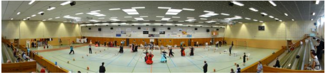
Sommerturniere 2013 in der Sachsenhalle Chemnitz