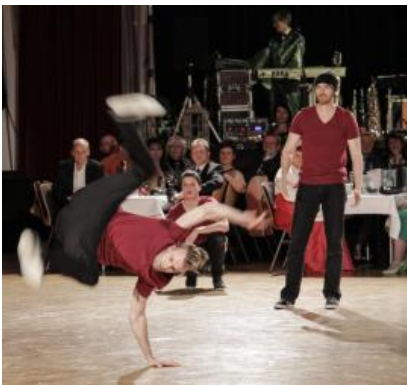
Breakdance Crew L.E. Alive