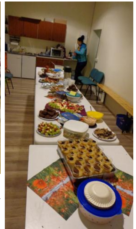
Das beliebte "do it your self" Buffett

Der Deutsche Tanzsportverband verleiht für tanzsportliche Leistungen das Deutsche Tanzsport-Abzeichen. Für das DTSA gelten die gleichen Rahmenbedingungen wie für das vom Deutschen Sport Bund (DSB) verliehene Deutsche Sportabzeichen. Es ist die offizielle Auszeichnung des DTV für gutes Tanzen und körperliche Fitness. Um die 120.000 Tänzerinnen und Tänzer haben das DTSA bereits erworben. So haben auch dieses mal die gemeldeten Paare des Tanzklub "Orchidee" das angestrebte Tanzsportabzeichen erfolgreich bestanden. Herzlichen Glückwunsch!